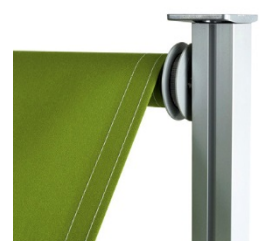
BC26 monteras enkelt med de robusta stödbenen, som fästs mellan golv och tak.