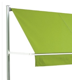
Fallarmar med justerbar fjäderspänning för optimal dukspänning.